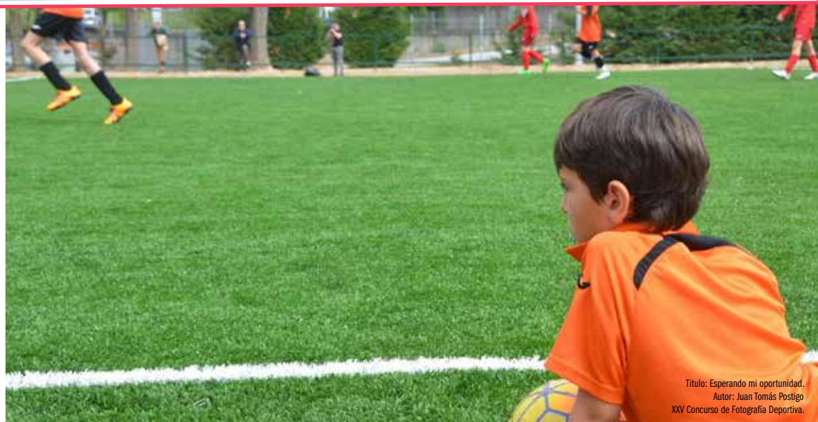
Título: Esperando mi oportunidad. Autor: Juan Tomás Postigo XXV Concurso de Fotografía Deportiva.

Unión Deportiva Cultural Sur, C.D. 607 324 668