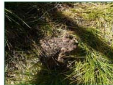
SAPO DE GREDOS